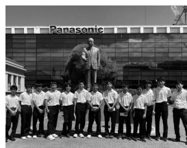
パナソニックミュージアムで記念撮影