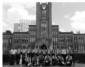
安田講堂を背景に