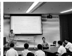
青田様による企業の概要紹介